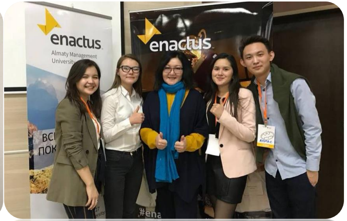
«Project Night» жобаларды құру чемпионаты Enactus Алмау, 20.01. – 03.02.2018