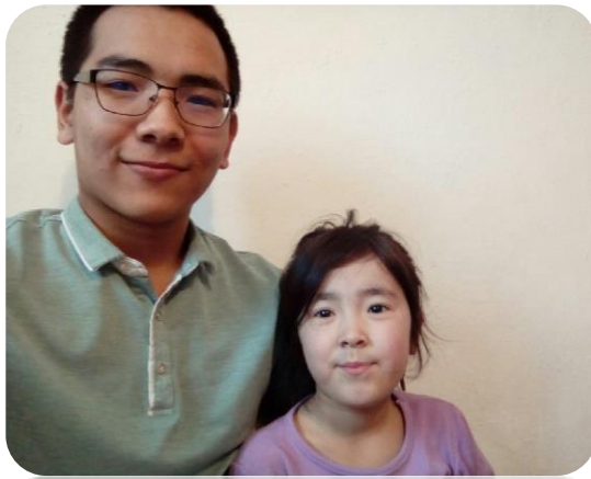
«Перзент» балалар үйінің жеткіншектеріне сабақтан көмек беру СДУ, 13.01. – 31.02.2018