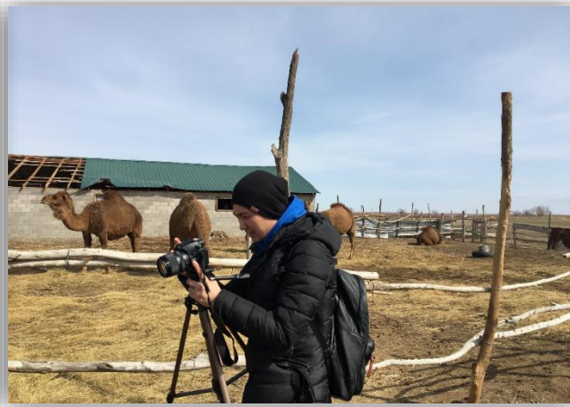
«ZHASMILK» жобасы Enactus АлмаУ, 07.02. – 24.03.2018