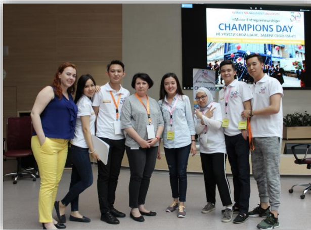
«Champions Day» – мектеп түлектері байқауы АлмаУ Кәсіпкерлік пен инновацияларды дамыту орталығы, 19.05. – 20.05.2018