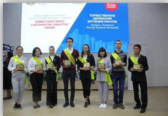
2018 жылғы білімгерлерді құттықтау салтанаты