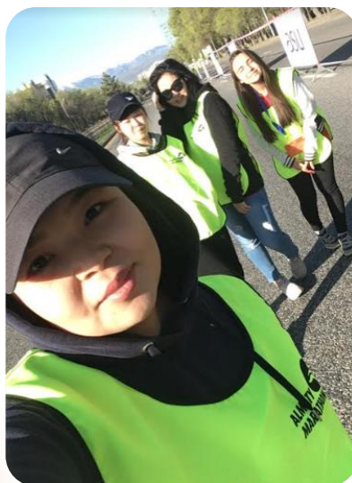
Алматы Марафоны 14.04. – 22.04.2018