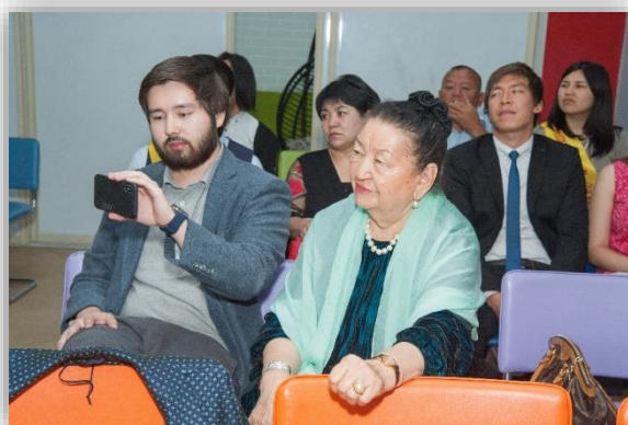
2018 жылғы түлектерді марапаттау салтанаты

19 білімгер алмасу бағдарламасы бойынша шетелде білім алды