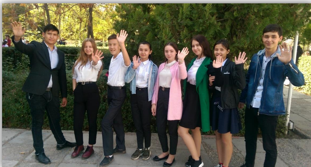
2018 жылғы Кентау қаласындағы білімгерлерді құттықтау рәсімі

Ержан Тәтішев атындағы шәкіртақы бағдарламасы, аталып кеткен бағдарламалар секілді, Ержан Нұрелдайымұлы Тәтішевтің нәр алған атамекені, Кентау қаласындағы №16 мектеп-лицейіне арнайы жасаған эксклюзивті өнімі болып келеді. Бағдарлама аясында жыл сайын 8,9,10 және 11 сынып арасында әлеуметтік жобалар байқауы өткізіледі. Үздік жоба иелері Бағдарламаның арнайы шәкіртақысымен марапатталады. Білімгер атағына алдыңғы оқу жылы ішінде жақсы оқу үлгерімін көрсеткен, түрлі пәндер сайыстарында, спорт пен музыкада жетістіктері бар және де мектеп өмірін жақсартуға үлесін қосқысы келетіндер күресе алады. Бағдарлама жастар ықыластарын қолдауға бағытталған және де оларды жобамен жұмыс істеуді үйретеді, жоспар құрып, жұмыс үдерістерін ұйымдастыруды, тек өзіне ғана емес, өз командасына да жауапкершілікті ала білуді, қарым-қатынас және көпті ұйымдастыру дағдыларын дамытуға және де алға қойылған мәселелерді көшбасшы позициясынан шеше білуге көмектеседі. 2008 жылдан қазіргі уақытқа дейін 92 оқушы арнайы шәкіртақымен марапатталды. 2018 жылғы байқауында Қор 8 жобаны мақұлдады. Байқау қатысушыларының жобалары мектептің іші-сыртын, санитарлық жағдайын жақсартуға және мектептегі елеулі оқиғаларын жария етуге бағытталған.