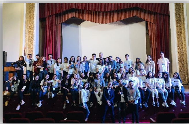
Көшбасшылықты дамыту күні AIESEC, КИМЭП Университеті, 23.09.2018

«Бестірек» бағдарламасының білімгерлері «менеджмент» және «маркетинг» мамандықтарында қосымша «кәсіпкерлік» модулімен білім алуда. Университет менторларының қолдауы, бизнесмен және коучтардың мастер-класстар, өз ісін жасауға және ілгері жылжытуға байланысты әр түрлі іс-шаралар өз алдына білімді қолданбалы, ал білім алу үдерісін қызықты қылуға көмектеседі.